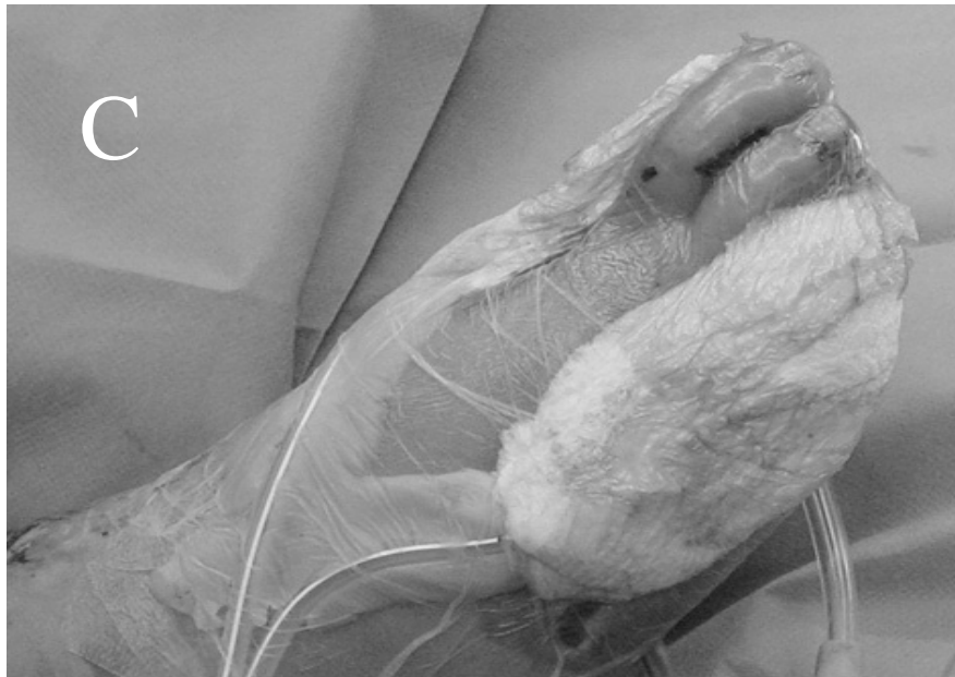
Fig. 1 Methods of VAC therapy A: After surgical debridement B: Application of sponge and drainage tube C: Closure with transparent adhesive drape and application of negative pressure