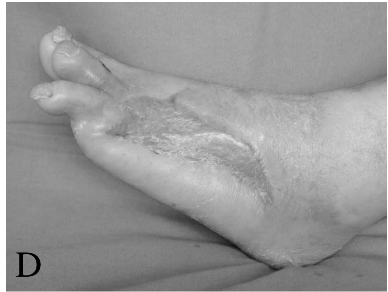
Fig.2 Effects of VAC therapy on 53-years old man A:Surgical debridement was performed before VAC. B:VAC therapy of 2 weeks remarkably accelerated granulation on the wound. C:The wound became flat with additional VAC of 1 week and ready for skin grafting. D:The stump of digit amputation completely healed with skin grafting.