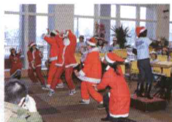
ブラスアンサンブル