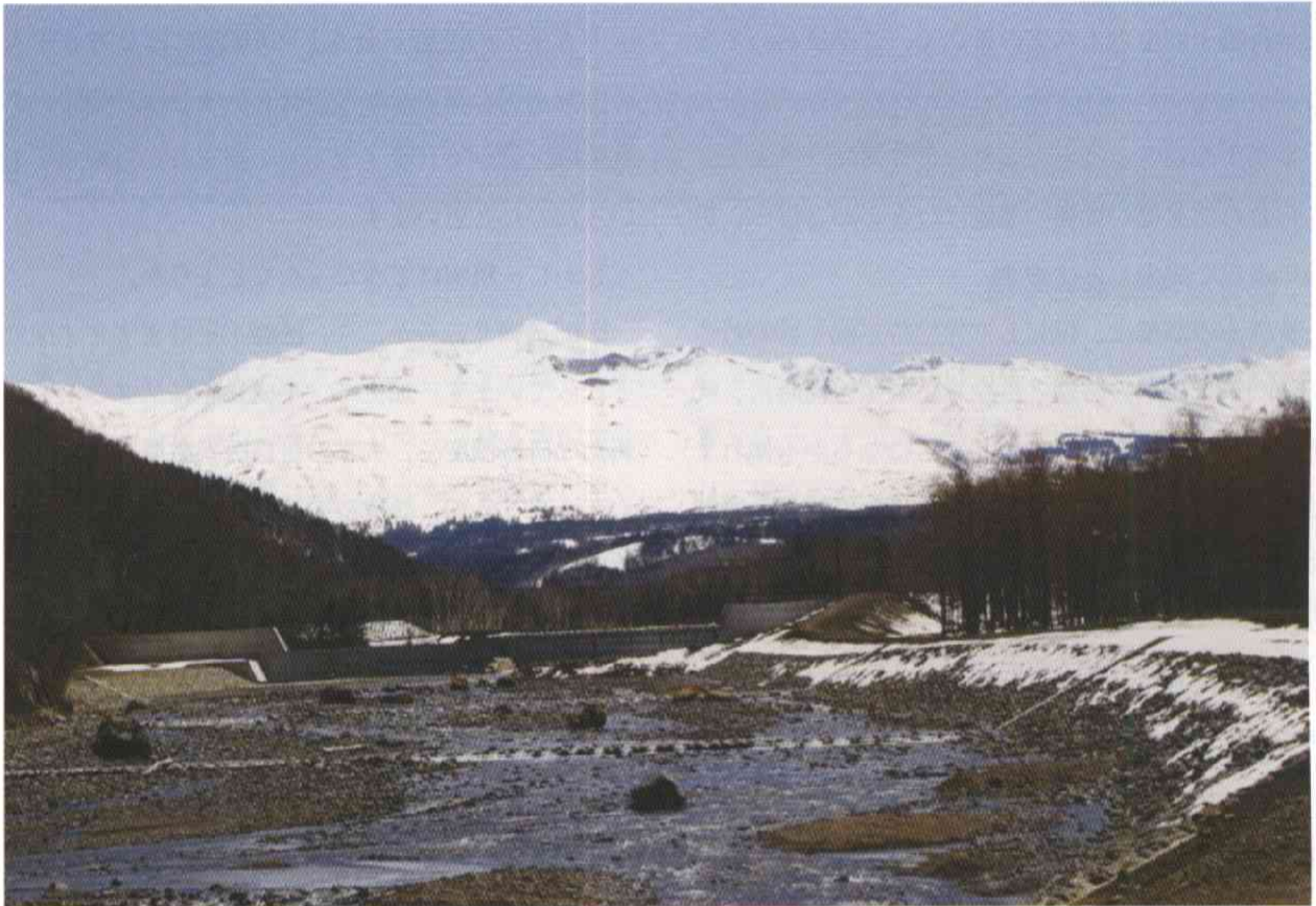
白金より望む十勝岳 (美瑛町)