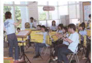
ブラスアンサンブル