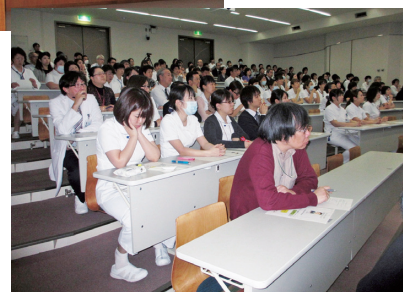
講演会会場（看護学科棟大講義室）