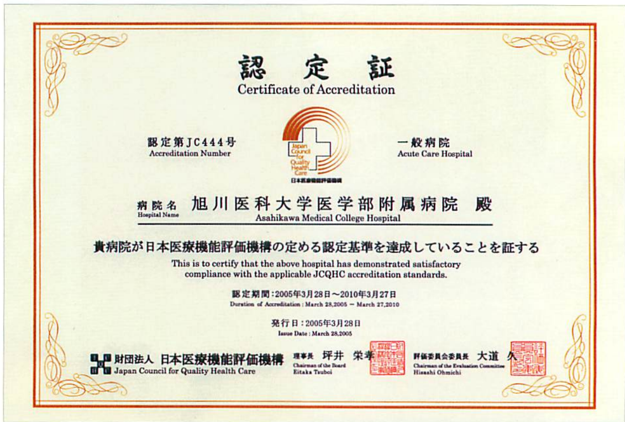
平成17年3月28日病院機能評価認定証を取得