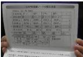
【図 7】生体情報(ノート)

その他、医師が遠隔診察で確認したい項目である「顔色など患者の全身」、「排液の性状」、「患者の生体情報を記録したノートの数値」についても遠隔より十分な品質で目視ができるとの主観評価を得た。