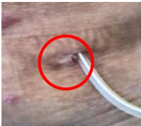
【図 3】2009 年 5 月 18 日 (Panasonic にて撮影)

【図 3】その後遠隔で経過観察を行ったが消失を目視で確認できた。【図 4】は当日遠隔操作で撮影した画像である。