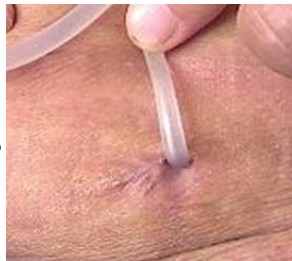
【図 4】2009 年 6 月 8 日 (AXIS にて撮影)